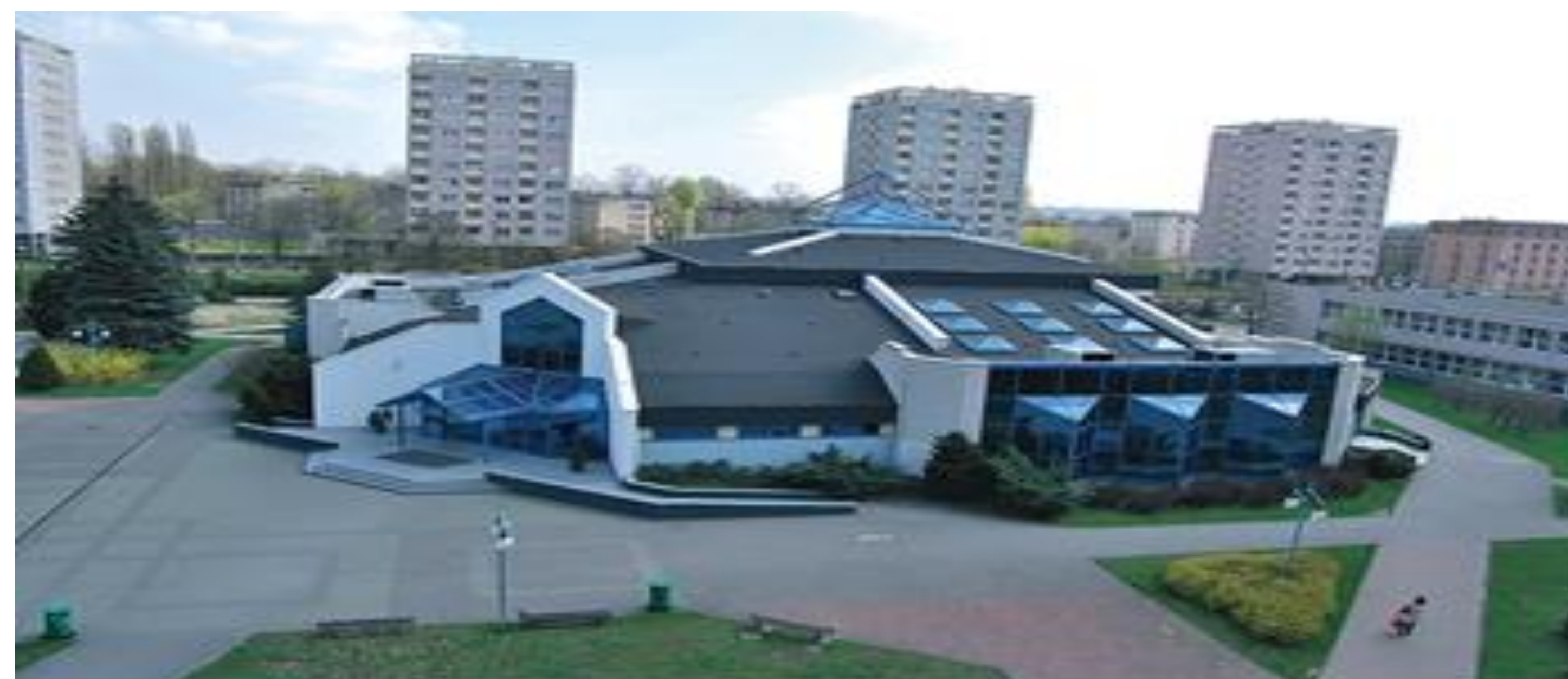
Politechnika Częstochowska, Wydział Zarządzania, Al. Armii Krajowej 19 B