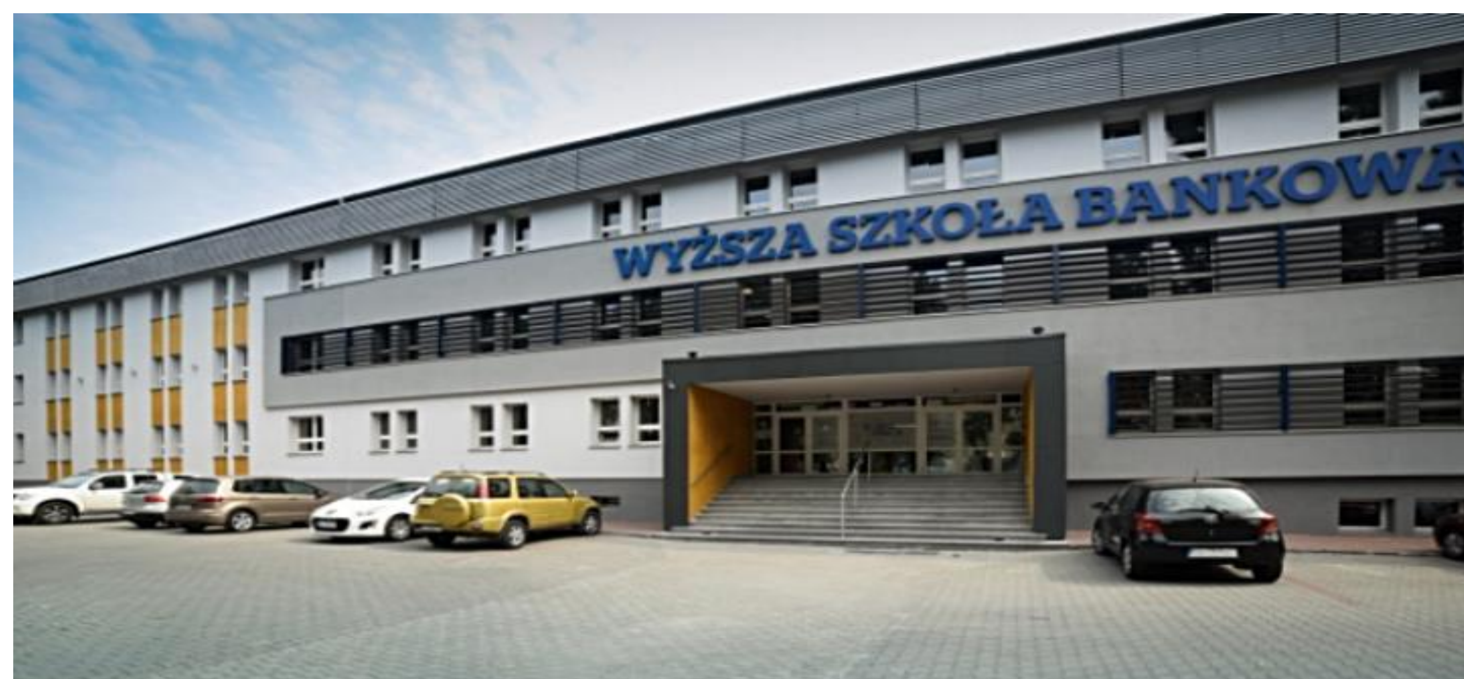
Uniwersytet WSB Merito w Poznaniu Filia w Chorzowie, ul. Sportowa 29