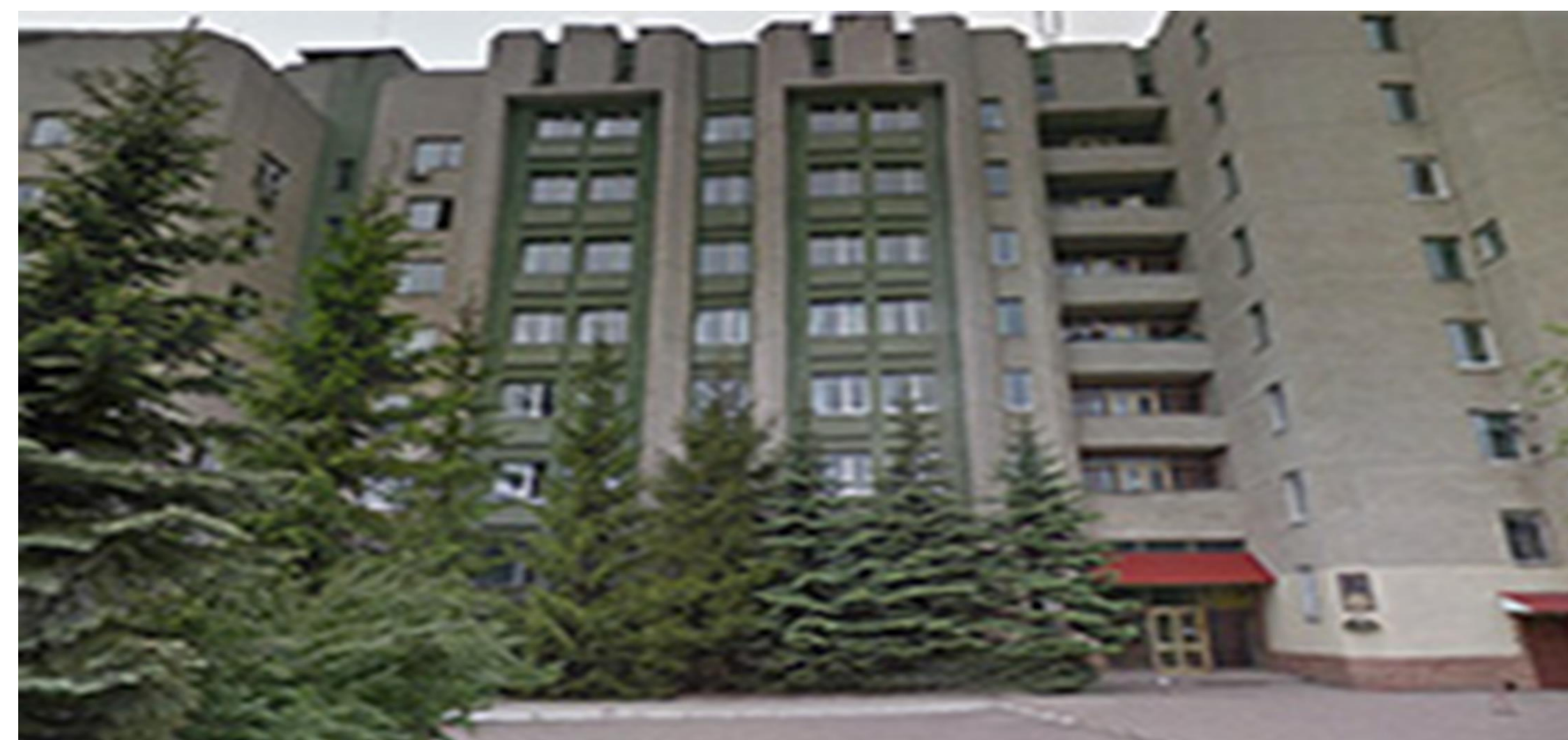
PI Instytut Badań Regionalnych im M.I. Doliszniego NAN Ukrainy, ul. Kozelnycka 4